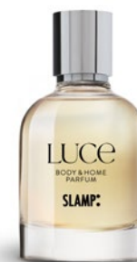
LUCE, BODY & HOME PARFUM

FAIRE LA LUMIÈRE POUR SLAMP NE SIGNIFIE PAS SEULEMENT RÉSOUDRE LE BESOIN DE VOIR UN OBJET OU UN ESPACE. SLAMP EST LA LUMIÈRE QUI CARESSE AU MOMENT OÙ L'ON FRANCHIT LA PORTE DE LA MAISON, LA PREMIÈRE QUI S'ALLUME, CELLE QUI RASSURE, QUI RÉCHAUFFE LE CŒUR . CELLE QUI, À CHAQUE ALLUMAGE, RAPPELLE LA CARESSE DE CELUI QU'ON A AIMÉ DANS LA VIE PLUS QUE TOUT.