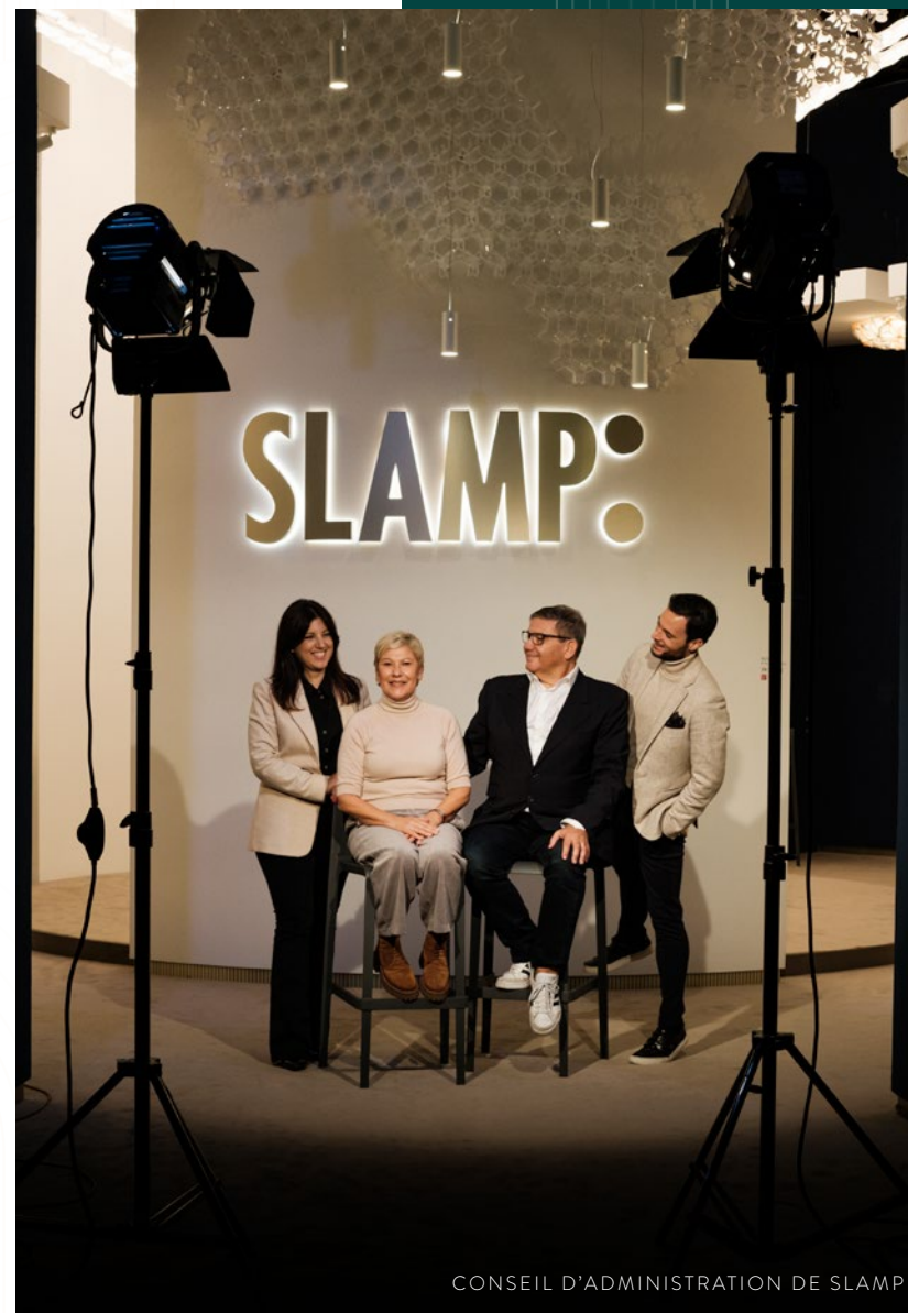
CONSEIL D'ADMINISTRATION DE SLAMP

AYANT LE PRIVILÈGE DE CONTRIBUER À LA CRÉATION D'UN MODÈLE CULTUREL DURABLE, SYSTÉMIQUE ET INCLUSIF , NOUS NOUS SENTONS RESPONSABLES DE NOTRE IMPACT SUR LA SOCIÉTÉ. GÉRER EFFICACEMENT ET STRATÉGIQUEMENT LES RESSOURCES DISPONIBLES, QU'ELLES SOIENT NATURELLES, FINANCIÈRES, HUMAINES OU RELATIONNELLES, PERMET DE GÉNÉRER DE LA VALEUR POUR L'ENTREPRISE EN CONTRIBUANT À LA CROISSANCE, À L'AMÉLIORATION ET AU DÉVELOPPEMENT SOCIO-ÉCONOMIQUE DE LA COMMUNAUTÉ DANS LAQUELLE ELLE ŒUVRE ET DES ACTEURS QUI EN COMPOSENT LA CHAÎNE DE VALEUR.