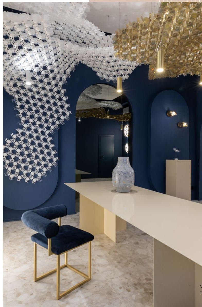
MILANO DUOMO FLAGSHIP STORE